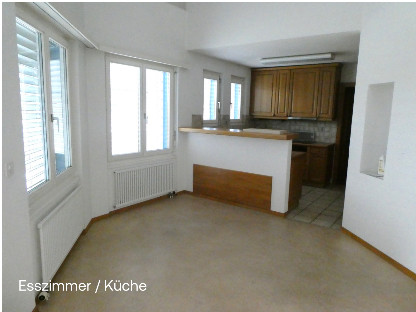
Esszimmer / Küche