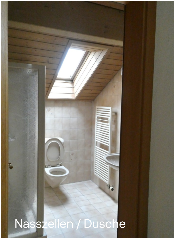
Nasszellen / Dusche