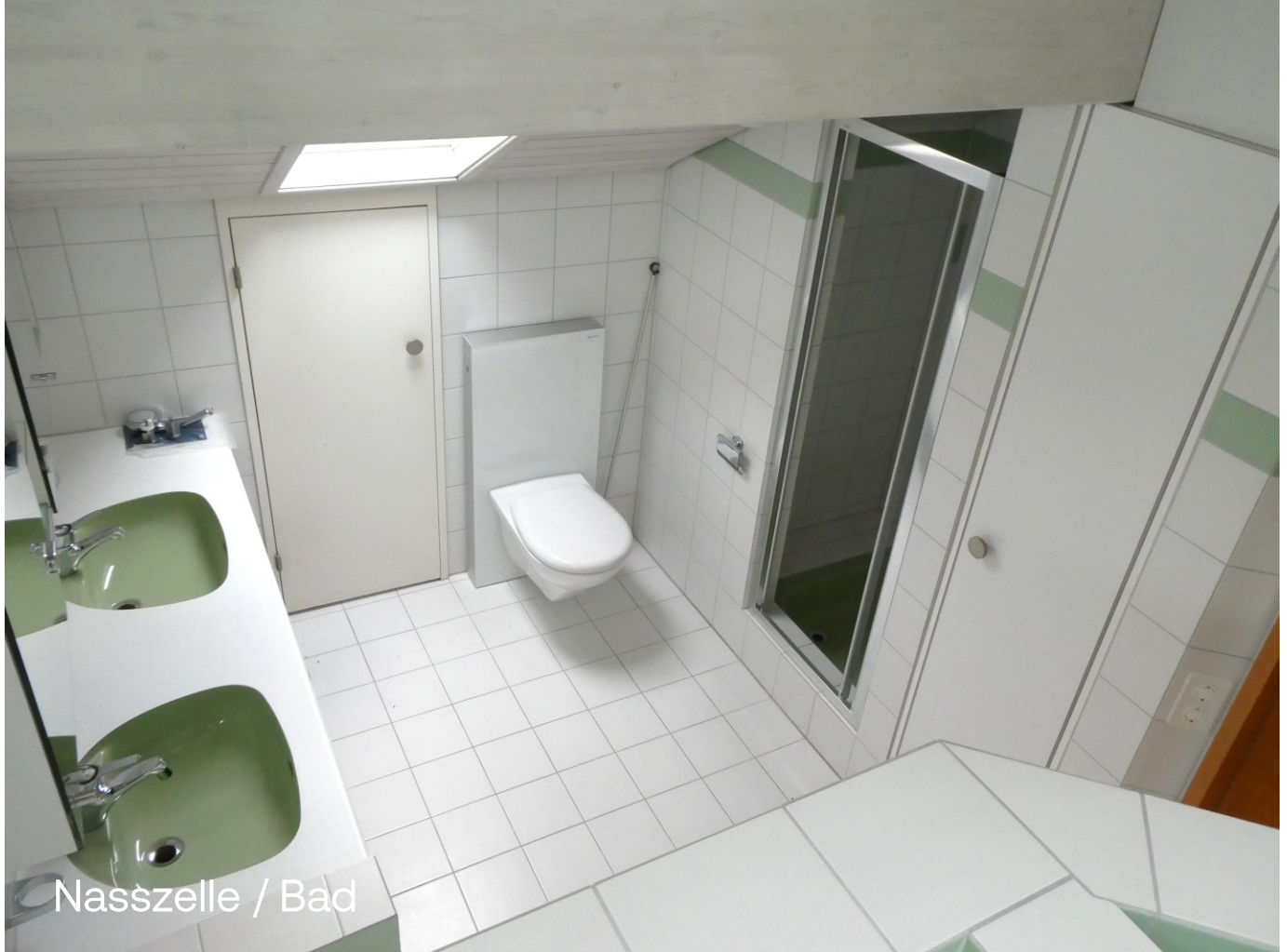
Nasszelle / Bad